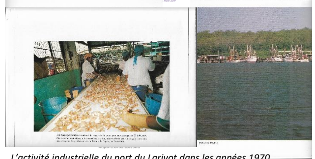
L'activité industrielle du port du Larivot dans les années 1970...